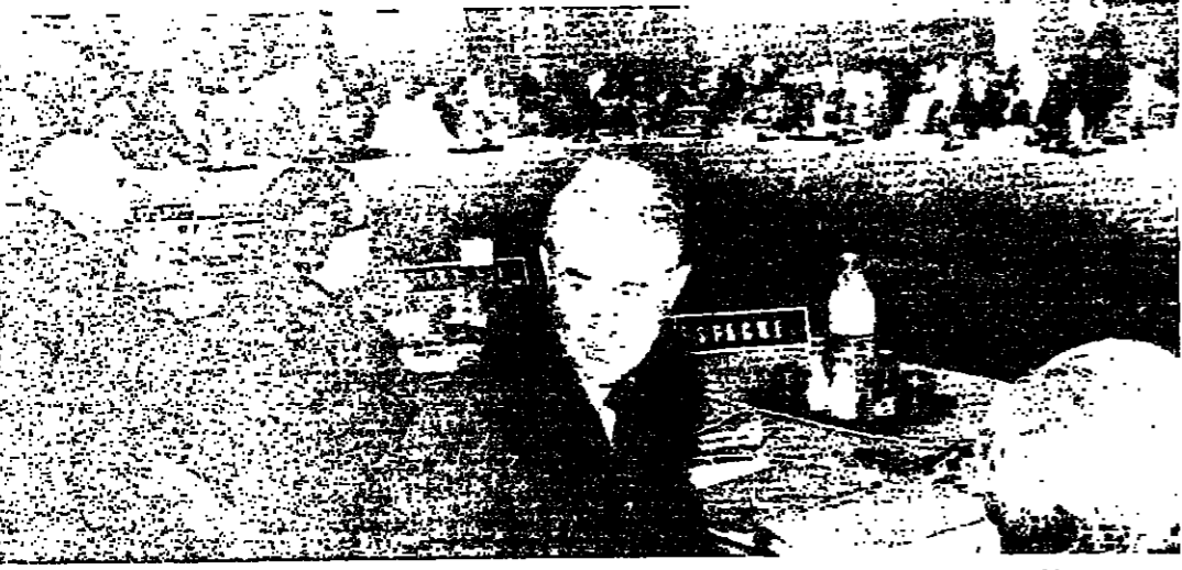
مؤتمر الشمال والجنوب لدى افتتاح مرحلته النهائية في باريس امس ٢٠ ويبدو في الخلفية سايروس غانسي وزير الخارجية الاميركي

يكن عمله لاعداد نظام مالي دولي باسم بصحة الدول . ويتصل لهذا الثالث في تغير هيكل الاقتصاد العالمي والملائك السامة بقيادة نظام اقتصادي عالمي جديد تجسد فيه امني العالم الثالث وهذا لا شك اصعب الاهداف ، ولكن اي اتفاق ولو كان جزئيا لن يصبح اذا لم يسجل تضامنا في هذا الاتجاه . الاولوية للطاقة وكان موضوع الطاقة من اهم المسائل التي احياها فالداهيم في كلمته حيث قال : ان هذا المؤتمر اتيقن مما اعتبر على تسيخته بلزمة الطاقة ولا بد من الاعتراف بان شبكة الطاقة لها بعدا عالميا يتطلب ملاما دوليا ، وان نظامنا العالمي قاصر ازاء هذه المسئلة . واقترح فالداهيم في هذا المجال استملاك للنظام العالمي ، وانتداب مؤسسة قادرة على الاسهام في اقامة نظام عالمي للطاقة ، وتكليف هذه المؤسسة بعرض الوطائف الاقتصادية مثل نظام لرد والمعلومات والاستغلال والاستثمار . ويراجع البحث بالإضافة الى اجيزة تتبع هذه المؤسسة بحيث تتشعب مصادر الطاقة . وقال فالداهيم انه من الصعب قيام مثل هذه المنظمة منطلقا من الامم المتحدة . وكان لوي دو غرينفو وزير الخارجية الفرنسي قد اقترح في الجلسة الاخيرة ان يطلع روي جينكينز رئيس لجنة السوق الأوروبية المشتركة للتدوين قوله : اننا لا نستطيع ان نتحمل بعد